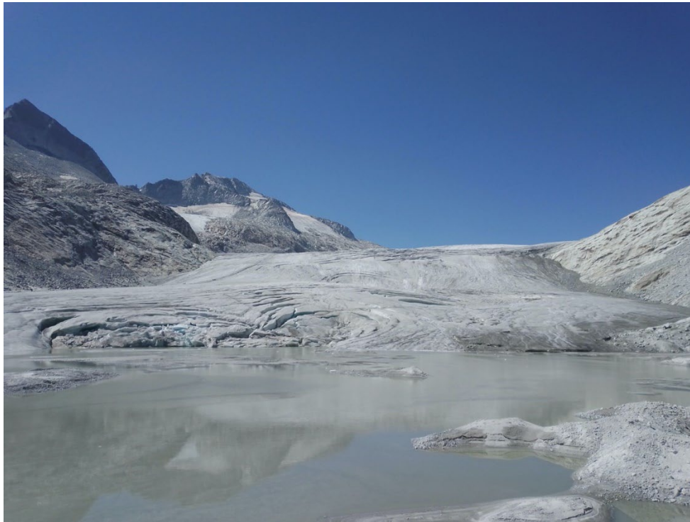
Figura 2 - Il “lago nuovissimo” formatosi presso la fronte del Ghiacciaio dell’Adamello ripreso il 18 luglio 2022

Le temperature dell’aria presso la diga di Pantano d’Avio, ai piedi del Monte Adamello sul versante lombardo, sono aumentate di circa 0.4^{\circ}\text{C} ogni dieci anni, con effetti molto gravi anche sul permafrost, la cui fusione rende instabili le pareti rocciose e aumenta il pericolo per gli alpinisti.