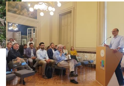
/ ROMA — UNIVERSITÀ DEGLI STUDI LA SAPIENZA - LUGLIO 2025