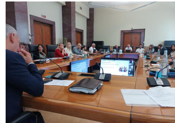
/ CATANIA - UNIVERSITÀ DEGLI STUDI DI CATANIA — GIUGNO 2024